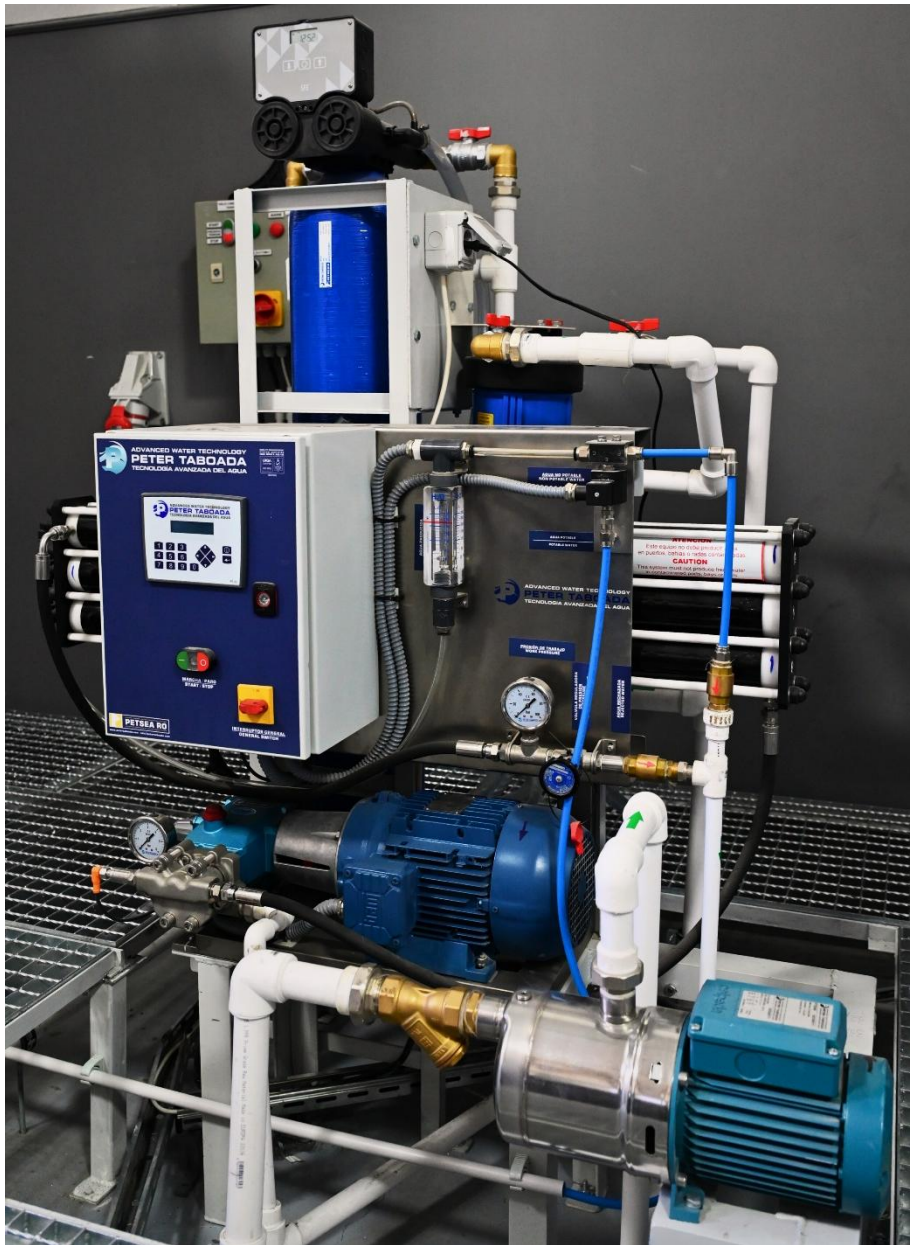
Desalinizator naval cu osmoză PETSEA 300